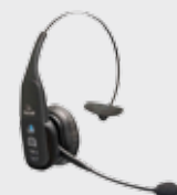
▪ 94ACC0127 Bluetooth Headset VX1 B350-XT