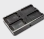
▪ 94A150074 4-Fach-Akkuladegerät