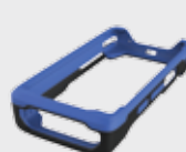
▪ 94ACC0132 Gummischutzmantel