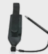
▪ 94ACC0133 Handschlaufe (im Lieferumfang dabei)